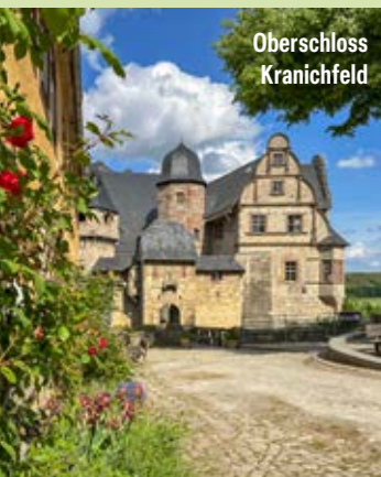
Ober Schloss Kranichfeld

Unsere TaktBus-Linie 311 bringt Fahrgäste nicht nur zuverlässig zum Einkaufen und zur Arbeit, sondern eignet sich auch hervorragend für verschiedene Ausflüge in die Region. Folgende Ziele werden von der 311 angefahren.