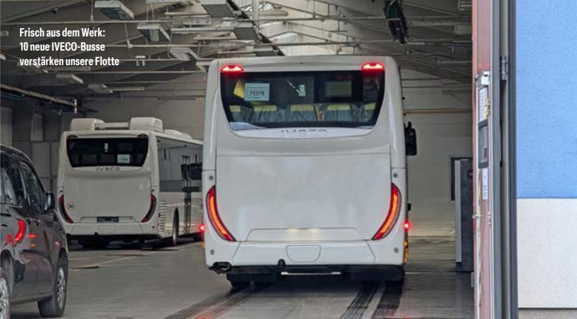
Frisch aus dem Werk: 10 neue IVECO-Busse verstärken unsere Flotte

Detaillierte Abfahrtszeiten und weitere Haltestellen der Linie 311 gibt es hier: www.ikv-ilmkreis.de/fahrplan/fahrplan