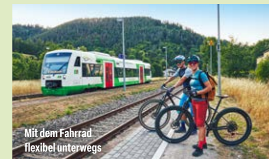
Mit dem Fahrrad flexibel unterwegs

Worauf Sie bei einem Ausflug mit Fahrrad und ÖPNV achten müssen