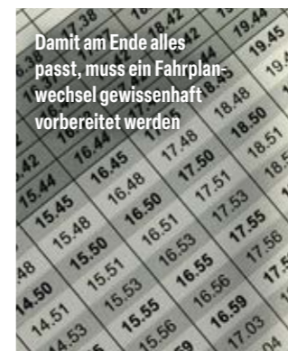
Damit am Ende alles passt, muss ein Fahrplanwechsel gewissenhaft vorbereitet werden